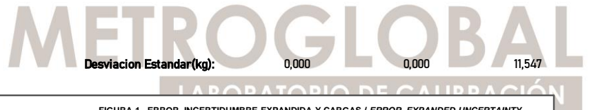
FIGURA 1. ERROR, INCERTIDUMBRE EXPANDIDA Y CARGAS / ERROR, EXPANDED UNCERTAINTY AND LOADS

Desviación Estandar(kg): 0,000 0,000 11,547