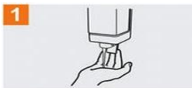
Deposite en la palma de la mano una cantidad de jabón suficiente para cubrir todas las superficies de las manos;