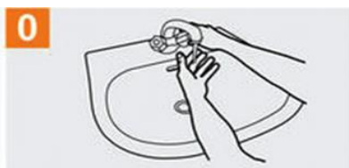
Mójese las manos con agua