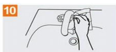
Sírvase de la toalla para cerrar el grifo;