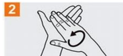
Frótese las palmas de las manos entre sí;