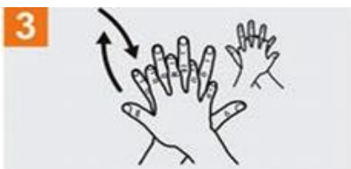
Frótese la palma de la mano derecha contra el dorso de la mano izquierda entrelazando los dedos y viceversa;