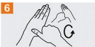
Frótese con un movimiento de rotación el pulgar izquierdo, atrapándolo con la palma de mano derecha y viceversa;