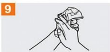
Séquese con una toalla desechable;