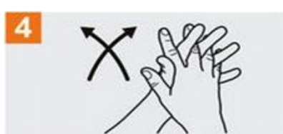
Frótese las palmas de las manos entre sí, con los dedos entrelazados;