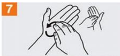
Frótese la punta de dedos de la mano derecha contra la palma de mano izquierda contra la palma de la mano izquierda, haciendo un movimiento de rotación y viceversa;