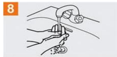
Enjuáguese las manos con agua;