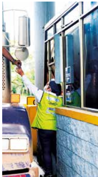
Las estaciones de peaje del Proyecto registraron un tráfico anual de 8.461.803 de vehículos en el 2022.