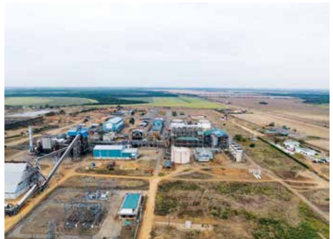
Bioenergy y la Fazenda son dos empresas ubicadas en la vía Puerto López – Puerto Gaitán.