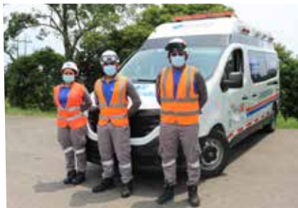
Las ambulancias son vehículos de Transporte Asistencial Medicalizado (TAM) dotados de un médico, auxiliar de enfermería y conductor.

Para prestar asistencia a los usuarios de las vías del proyecto Malla Vial del Meta, la Concesión dispone en los corredores Villavicencio Granada y Villavicencio – Puerto López – Puerto Gaitán – Puente Arimena de seis ambulancias, dos carros taller, ocho grúas y cinco grupos de inspectores viales. Además, la Policía de Tránsito y Transporte presta seguridad en las vías.