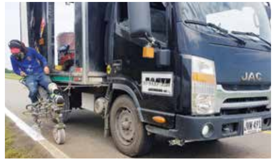
Se efectuó la demarcación horizontal (líneas blancas de borde y amarilla en el eje) de 535.158 metros.