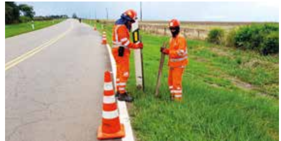
Para mejorar las condiciones de seguridad vial se instalaron 200 delineadores de corona a lo largo de las vías del proyecto.