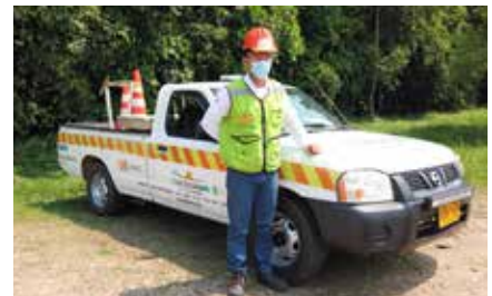
Los carros-talleres prestan asistencia a los conductores que tengan problemas mecánicos en la vía.