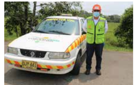
En cada turno hay cinco inspectores, en los diferentes corredores viales, para reportar y atender las novedades que se presenten.