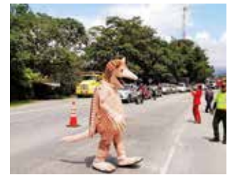
Las campañas de cultura vial que se realizan en los corredores viales contribuyen a disminuir los índices de accidentalidad.