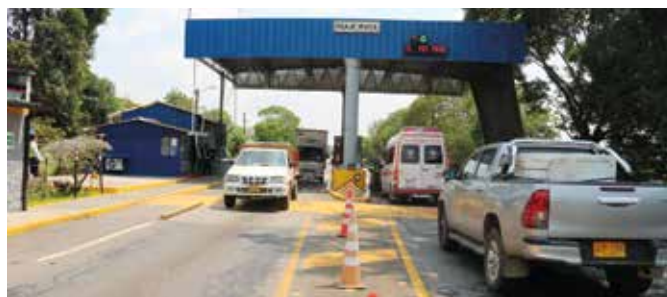
Con el incremento del TPD este año la vía Villavicencio – Granada fue la que más tráfico registro.

El tráfico promedio diario (TPD) registrado en 2022 fue de 23.183 vehículos, de los cuales el 65% (15.007 vehículos) corresponde a la vía Villavicencio - Granada y el 35% restante (8.120 vehículos) al corredor vial Vi-