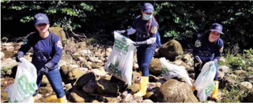
En el municipio de Acacías se realizó la limpieza de un tramo del río Acaciñas que pasa por el casco urbano.