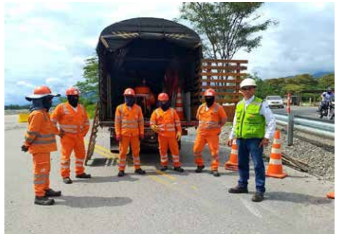
Los trabajadores tanto del Concesionario como de proveedores aplican todos los protocolos de Seguridad y Salud en el Trabajo (SST).

Las principales actividades ejecutadas en 2022 en los mantenimientos programados fueron: