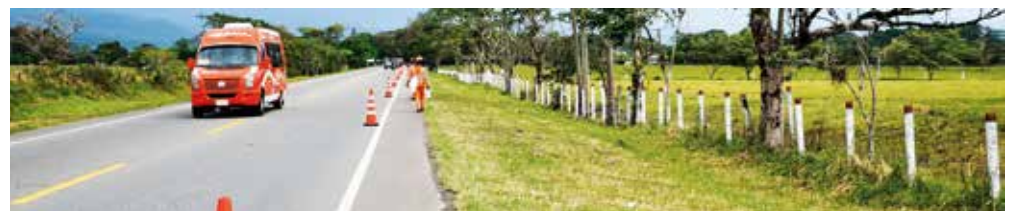
La buena señalización de las vías es importante para que la movilidad de los usuarios transcurra con más seguridad.