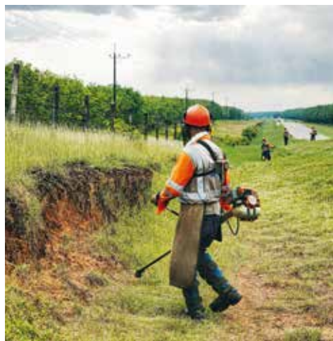
Durante el año pasado se efectuó la rocería de 3.180 kilómetros en el derecho de vía de los corredores del Proyecto.