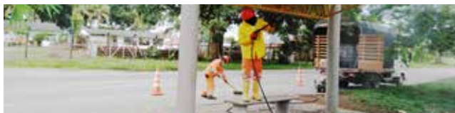
El lavado de paraderos y postes SOS también fue una actividad de mantenimiento.