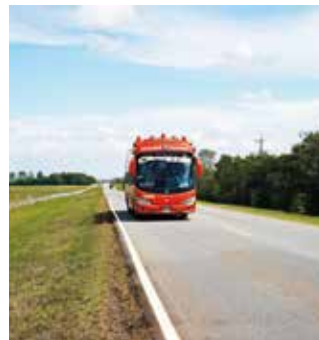
La movilidad de tráfico pesado hacia la altillanura fue significativa este año.

llavicencio - Puerto Gaitán. El TPD del año 2022 corresponde al mayor tráfico registrado desde los inicios de la concesión en 2015.