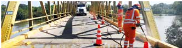
En 2022 se lavaron las barandas de cinco puentes del Proyecto Malla Vial del Meta.