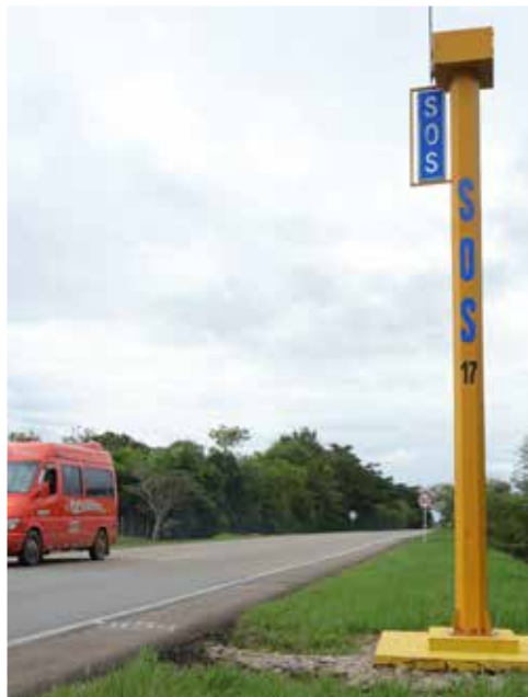
Los usuarios pueden solicitar el servicio que requieran o reportar novedades en la vía desde los postes SOS.