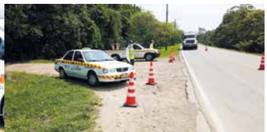
Durante el año pasado se prestaron 12102 servicios en los diferentes corredores viales del proyecto.