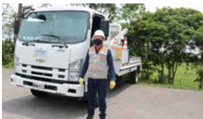
Las grúas asisten a los usuarios que no pueden ser desvarados y requieren traslado a un taller. Los llevan al municipio más cercano.