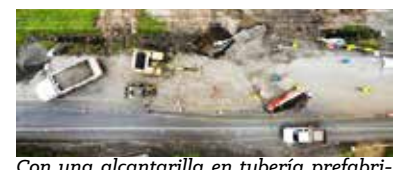
Con una alcantarilla en tubería prefabricada de 2,45 metros de diámetro y 27 metros de longitud se solucionó la transitabilidad en La Nohora.