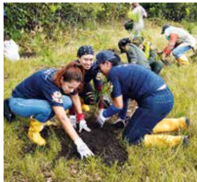
También una zona verde del casco urbano de San Martín se efectuó la siembra de palmas de moriche.

Siembra de 902 árboles en San Martín y Villavicencio. El 18 de noviembre 50 voluntarios de la Concesión Vial de los Llanos, el Ejército Nacional, la Policía Nacional y la alcaldía de San Martín, participaron en la segunda versión del Día Conecta en el que sembraron 552 palmas de moriche, especie endémica del Llano, en la laguna de Cuadrillas ubicada en el casco urbano del municipio de San Martín.