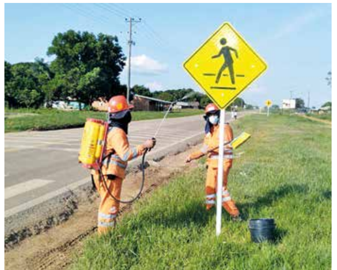
Durante este año 2022 se realizó la reversión al Invias del tramo Puerto Gaitán – Puente Arimena.