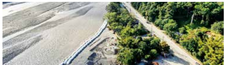
En el sector del Guayuriba de la vía a Acacías, se atendió el desbordamiento del río (se construyeron 720 ataguías con geocontenedores) para controlar el trasvase.