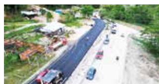
Se pavimentó el paso alternativo del K16 en la vía a Acacías para mejorar la movilidad y seguridad vial.