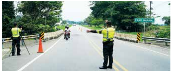
Los operativos de la Policía de Tránsito persuaden a los usuarios de cometer infracciones de tránsito.